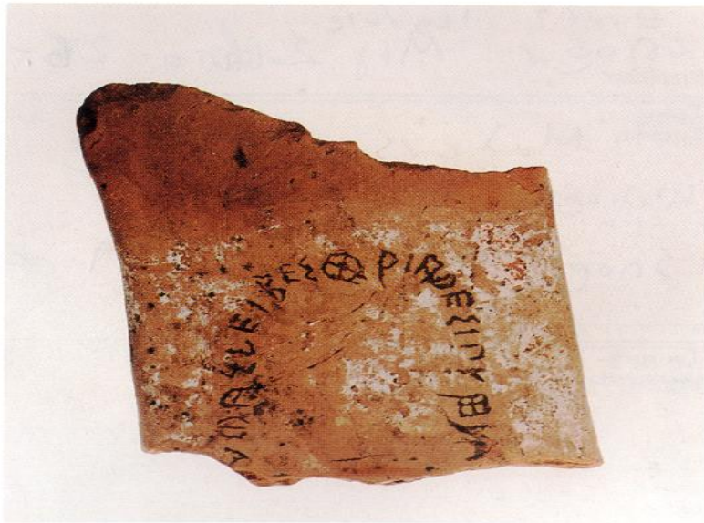
Αναθηματική επιγραφή στις Λειβηθριάδες σε ειδώλιο, 6ος π.Χ. αι. Votive inscription on a plank-shaped figurine 6th c B.C.