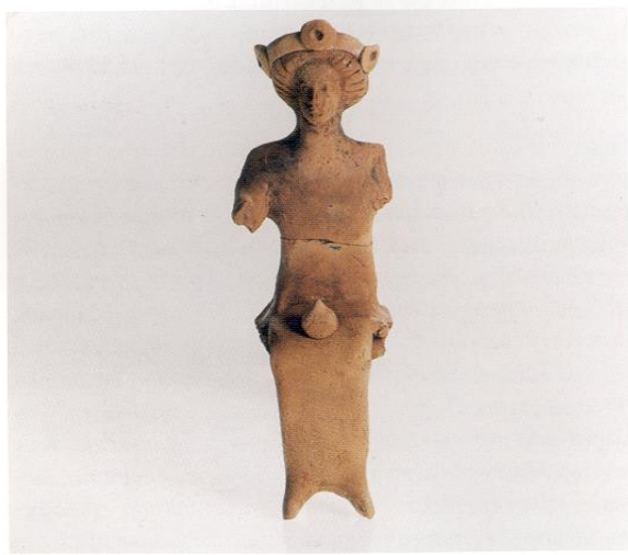
Ψευδοσανιδόσχημο ειδώλιο με προσφορά ροδιού, α' μισό 4ου π.Χ. αι. Pseudoplank-shaped figurine with a pomegranate. First half of 4th c.BC.

Η σπηλιά της νύμφης Κορώνειας είναι και γεωμορφολογικά ιδιαίτερη. Όπως και η περιοχή γενικότερα, χαρακτηρίζεται και το σπήλαιο από έναν έντονο τεκτονισμό όπου κυριαρχούν τα ρήγματα. Μπροστά στην είσοδο του υπάρχει μικρό τραπεζοειδές βύθισμα που έχει προέλθει από κατακρήμνιση. Πάνω από την είσοδο δεξιά, υπάρχει εγχάρακτη επιγραφή της Νύμφης Κορώνειας στην ονομαστική η οποία όπως φαίνεται "συγκατοίκησε" ταυτόχρονα ή διαδοχικά με τις Λειβηθρίδες, τις οποίες αναφέρει ο Στράβων και ο Πausανίας, παρόλο που ο δεύτερος δεν αναφέρει το όνομα Κορώνεια παρά μόνο ως τοπωνύμιο. Άνοιγμα στην οροφή, αφήνει τον ήλιο και το φεγγάρι να φωτίζουν τα ίχνη της αρχαίας θρησκείας και τη βροχή να ποτίζουν τις προσχώσεις τόσων αιώνων..