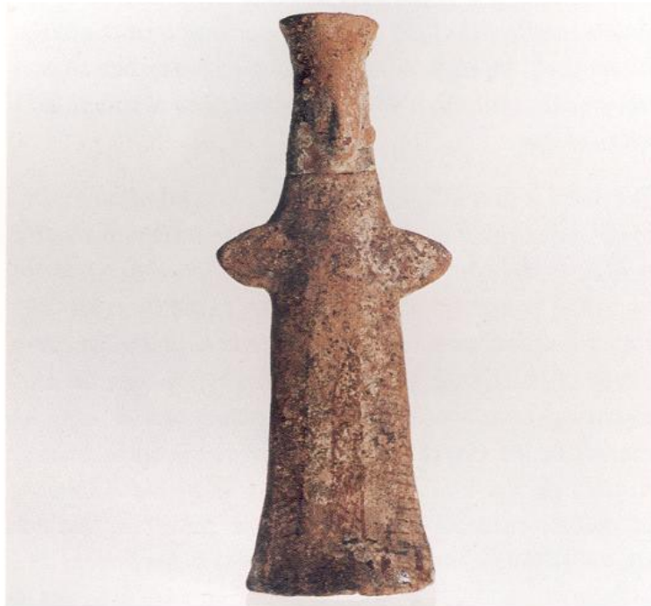
Σανιδόσχημο ειδώλιο, τέλος 6ου π.Χ. αι. Plank-shaped figurine. Late 6th c.BC.

αντιπροσωπεύεται με μεγάλο αριθμό και ποικιλία τύπων σε υπέροχα δείγματα.