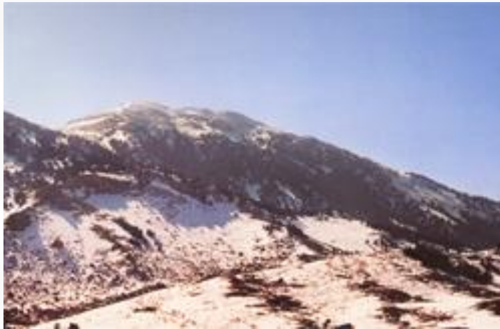
ΟΙΚΟΝΟΜΙΑ ΤΟΥ ΤΟΠΟΥ

το ύψος του οικισμού επηρεάζεται τόσο από τους φυσικούς και υλικούς πόρους της περιοχής όσο και από τις κλιματολογικές της συνθήκες. Η πέτρα του Ελικώνα που κυριαρχεί στην περιοχή δίνει έναν ιδιαίτερο τόνο στους οικισμούς.