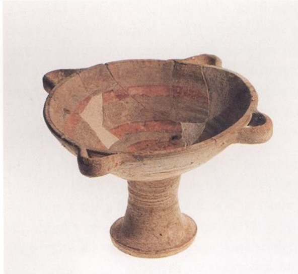
Βοιωτική κύλικα με ψηλό πόδι, 550 π.Χ. 13. Boeotian pedestalled kylix 550 BC.

επιγραφές επάνω σε αρχαϊκά ειδώλια και αγγεία , σωστές ή ανορθόγραφες ,κακότεχνες ή επιμελημένες και μεγάλος αριθμός από γραφίδες , που κάνουν ακόμη πιο ζωντανή την εικόνα της εγχάραξης στον πηλό και της ανάθεσης.